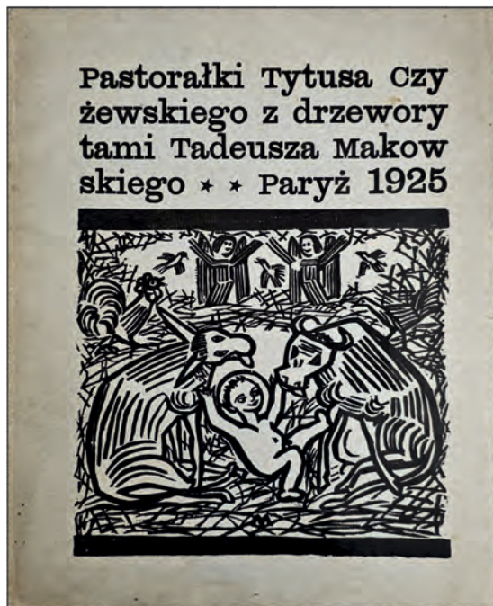
Czyżewski Tytus – Pastorałki. Drzeworyty Tadeusza Makowskiego