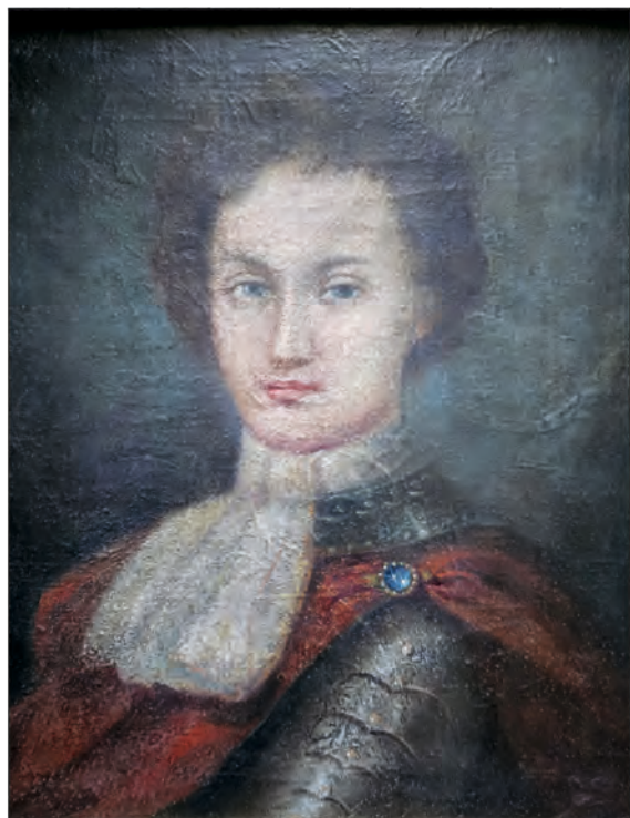
Sobieski Ludwika Jakub, XVIII w.