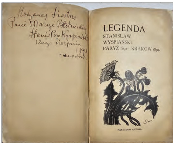
Wyspiański Stanisław – Legenda. Odręczna dedykacja autora.