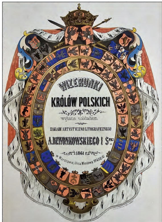
Życiorysy panujących w Polsce od Mieczysława Igo do Stanisława Augusta.