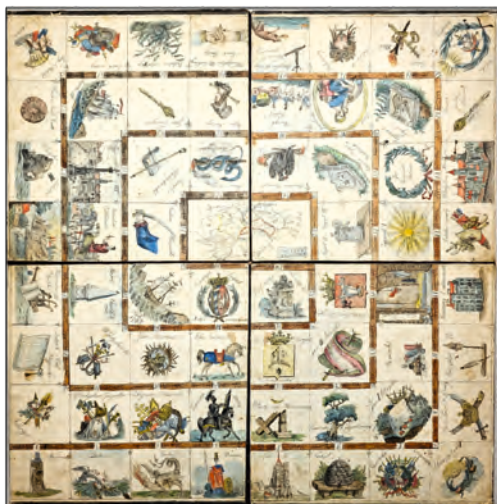
Assarmot – Pierwsza polska gra edukacyjna, ok. 1830